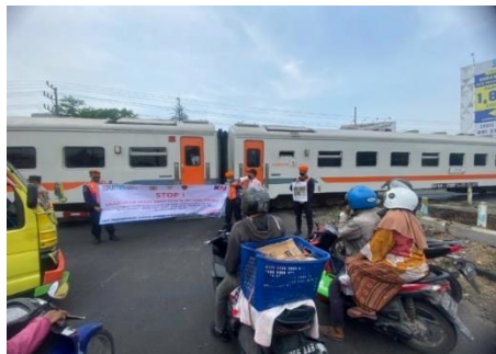
Gambar 1. Perlintasan Kereta Api Sebidang Daop 8 Gedangan Sidoarjo

Strategi Humas Daerah Operasi 8 Surabaya yaitu dengan cara bersosialisasi di perlintasan sebidang yang berpalang pitnu maupun tanpa palang pintu. Target sasaran kegiatan sosialisasi Pengguna Jalan Kegiatan sosialisasi dilaksanakan di perlintasan sebidang Daop 8 daerah Gedangan, Sidoarjo.