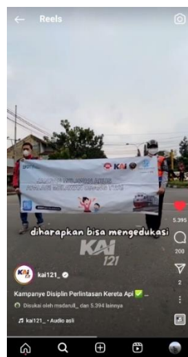
Gambar 3 Edukasi di media sosial Instagram

Humas PT. KAI Daop 8 Surabaya menggunakan media internet seperti instagram untuk memberikan informasi berupa konten edukasi kepada masyarakat mengenai keselamatan perjalanan saat melintasi perlintasan kereta api, dengan menjelaskan bahaya saat menerobos perlintasan serta merugikan diri sendiri dan pihak PT. KAI.